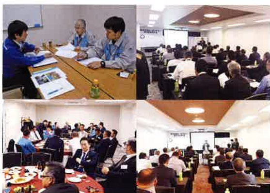
●ビーエスティー代理店研修会の様子