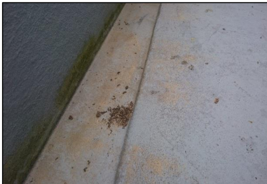
被害を被ったベランダ

そして、それだけの数の鳩の糞が雨樋に溜まり、雨樋が機能しなくなり、酷いところでは糞が土化して草が生えてくるところもあります。